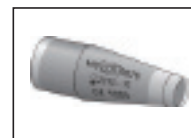
リユーザブル ゴールドマン メジャリングプリズム