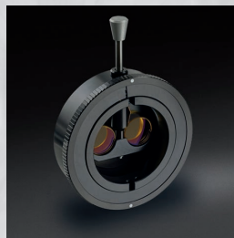
コントラストエンハンスing（イエロー）フィルタ （オプション）