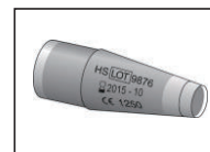
リユーザブル ゴールドマン メジャリングプリズム